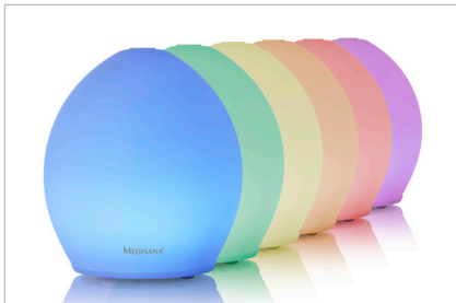
Wellnesslicht mit Farbwechsel in 6 Farben