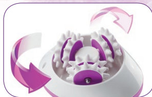
3 x 2 rotierende Massagerollen