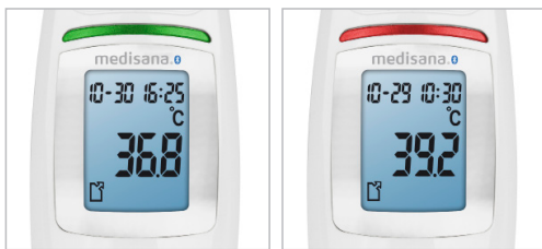
Optischer Fieberalarm durch Farbwechsel