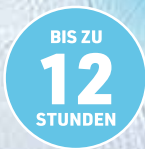
Laufleistung pro Tankfüllung