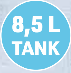
Kühlt & erfrischt mit reinem Wasser