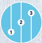
3 Geschwindigkeits- und Kühlstufen