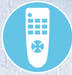
Inkl. praktischer Fernbedienung