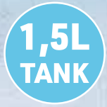
Kühlt & erfrischt mit reinem Wasser