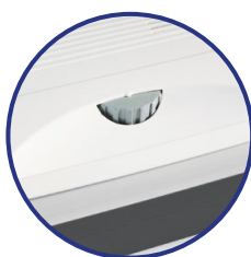
Großer manueller Min/Max Regler