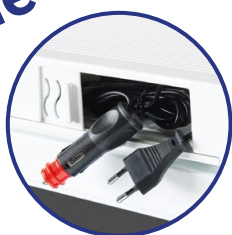
Großes Schiebe-/ Aufbewahrungsfach für 12/230V Stecker