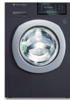
Titan Rock 8530.2CU3