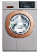
Ever Rose 8530.2CU2