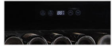
Elektronische Temperatur Einstellung