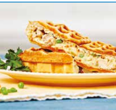
Croissant-Waffeln mit Hähnchenfüllung