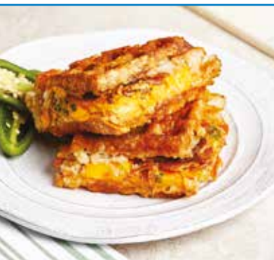
Glutenfreie Kartoffel-Waffeln mit Speck & Käse-Füllung

Hochwertige, pflegeleichte Anti-Haft-Beschichtung