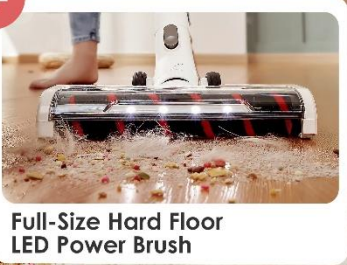
Full-Size Hard Floor LED Power Brush